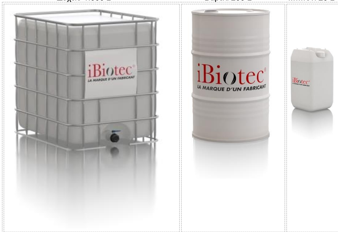
Μπιτόνι 20 L

iBiotec® Tec Industries®Service Z.I La Massane - 13210 Saint-Rémy de Provence – France Tél. +33(0)4 90 92 74 70 – Fax. +33 (0)4 90 92 32 32 www.ibiotec.fr